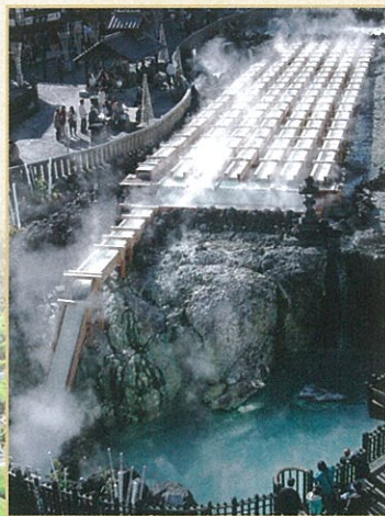
草津温泉 湯畑(草津町)