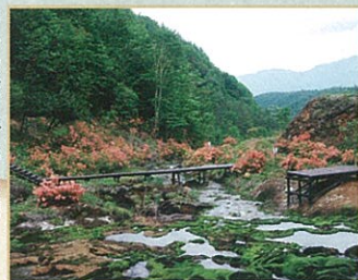
チャツボミゴケ公園

宿泊施設、キャンプ場、温泉をはじめ、テニスコート、グラウンド、遊歩道、展望台が設けられています。